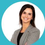
SOFIA SAMPAIO JALLES ARMESTO & ASOCIADOS