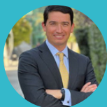
PATRICIO RÁMILA ALESSANDRI ABOGADOS