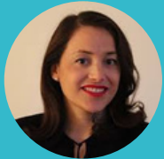
ASOID GARCÍA-MÁRQUEZ UNESCO