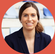
DRA. CAROLINE BECHTEL SUBDIRECTORA DEL INSTITUTO DE DERECHO DEPORTIVO EN LA UNIVERSIDAD ALEMANA DEL DEPORTE EN COLONIA